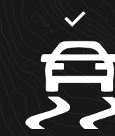
CONTROL ELECTRÓNICO DE ESTABILIDAD