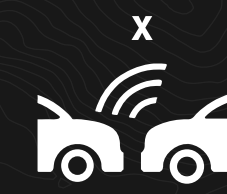
ALERTA DE COLISIÓN FRONTAL