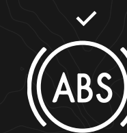
SISTEMA ANTIBLOQUEO DE FRENOS

Fotografías de referencia, algunos accesorios, colores, diseños y/o acabados pueden variar de las versiones comercializadas en Colombia y tener un costo adicional.