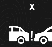
FRENADO AUTÓNOMO DE EMERGENCIA